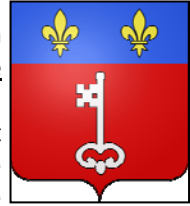
Château du Loir