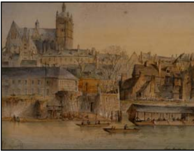
Vieux Le Mans